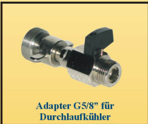
Adapter G5/8" für Durchlaufkühler