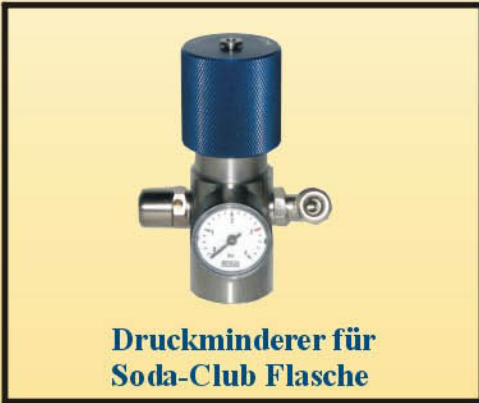
Druckminderer für Soda-Club Flasche