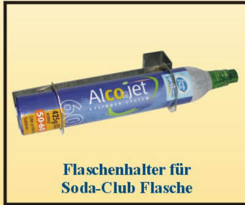
Flaschenhalter für Soda-Club Flasche