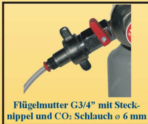
Flügelmutter G3/4" mit Steck- nippel und CO 2 Schlauch ø 6 mm